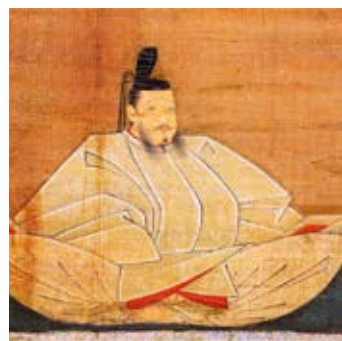
足利義持肖像 (神護寺藏)

のは山内上杉家の憲定(初代、九代、十一代を務めた憲頭から八番目となる)である。 ところが、応永十八年に上杉憲定が失脚すると、山内上杉家とは対立関係にあった犬懸上杉家の氏憲が関東管領に就任する。 犬懸・山内両上杉家の葛藤 若年で鎌倉公方となった足利持氏は、犬懸上杉家の氏憲に補佐されていたが、応永二十二年(1415)四月の評定で持氏が氏憲と対立する。五月に氏憲は関東管領を更迭されて、山内上杉家の上杉憲基(憲定の子)が後任の管領となった。 犬懸上杉の氏憲は・・・ すると、翌応永二十三年、足利氏満(第二代鎌倉公方)の三男、満隆と、足利満兼(第三代鎌倉公方)の子、持仲らと諮り、地方の国人衆を加えて反乱を起こす。四代目の鎌倉公方となった、若い持氏に代わり、鎌倉府の実権を掌握しようとしたのである。 同年十月、二代目の鎌倉公方、満兼の弟となる満隆が挙兵し、氏憲と共に持氏・憲基の拘束に向かう。だが、持氏らは家臣に連れられてすでに脱出していたので(「鎌倉大草紙」)、氏憲と満隆は鎌倉を制圧下に置く。