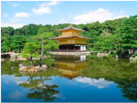
再建された「鹿苑寺」

倭寇に対して義満は・・・ 明が建国されたところ(1368年、明朝の洪武元年)、朝鮮半島や中国、大陸の沿岸を襲い、食料を奪って人身の略奪を行う海賊が活動して